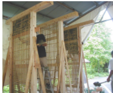
耐震実験 (H15 年)