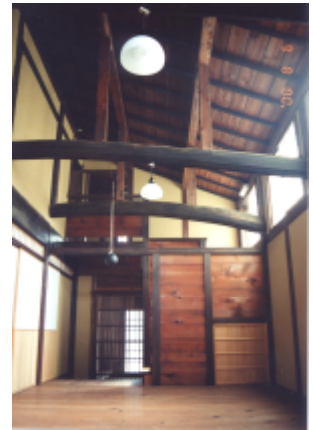
会場の土壁の町家 (日本で初めて実験で防火・耐震改修の有効性を検証した町家)

なお、お申込みと同時に参加受理とさせて頂き、ご連絡は定員締切後に申込みのあった方のみさせていただきます。