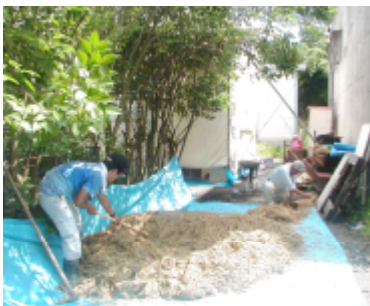
試験体の製作 (H15 年)